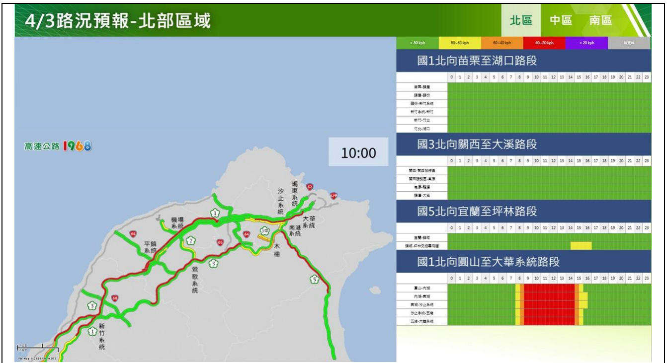
清明節連假第 1 日路況預報圖(北區北向)