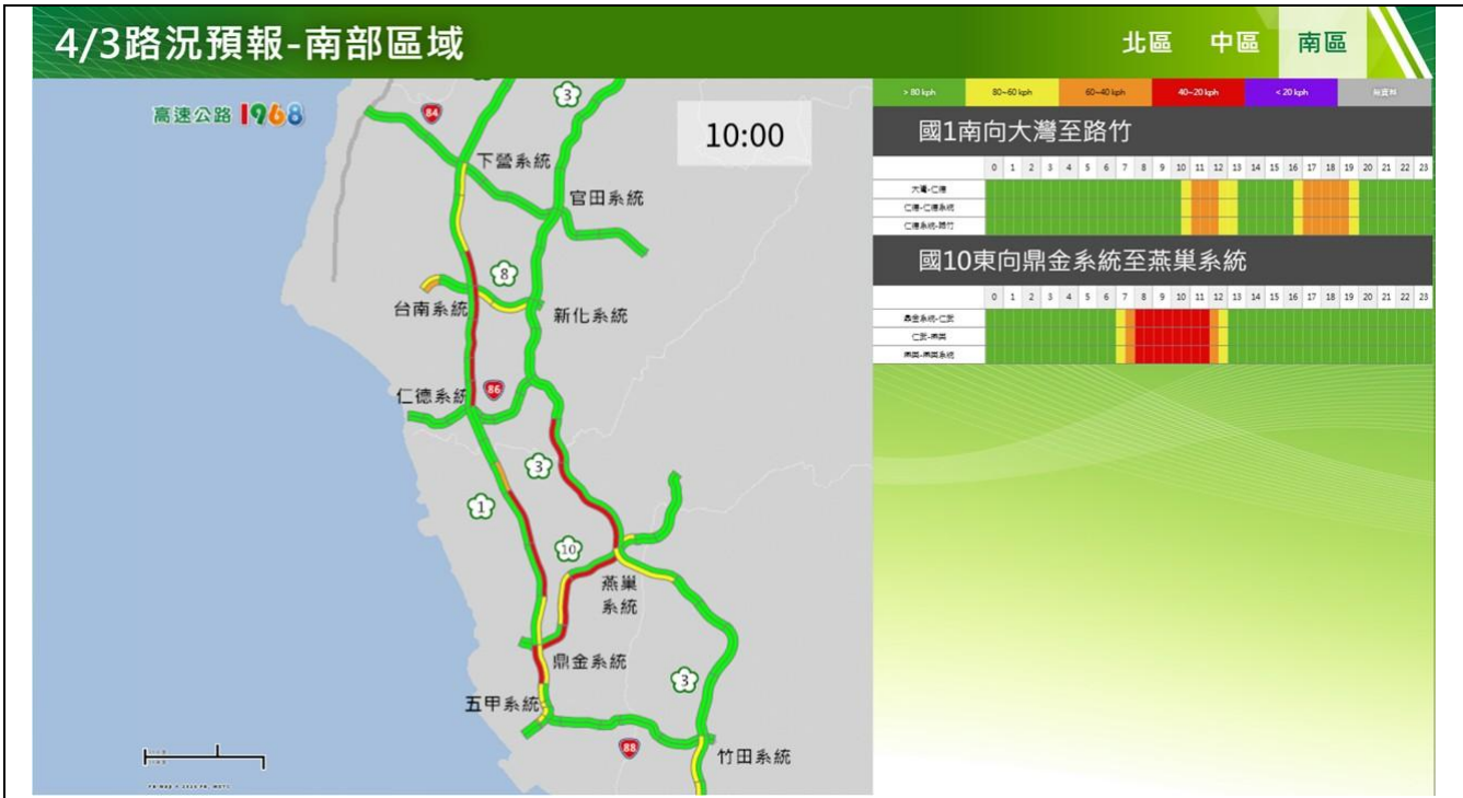
清明節連假第 1 日路況預報圖(南區)