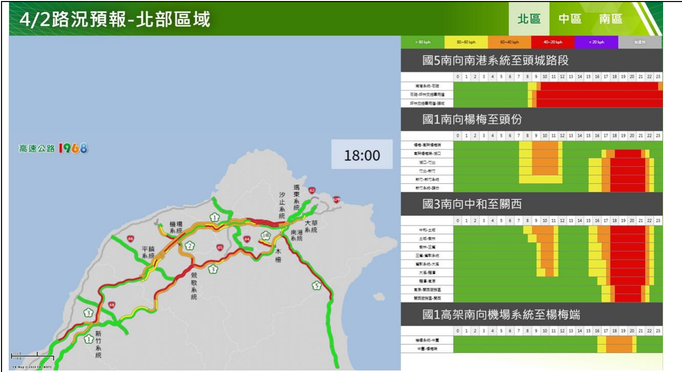
清明節連假前 1 日(上班日)路況預報圖(北區)