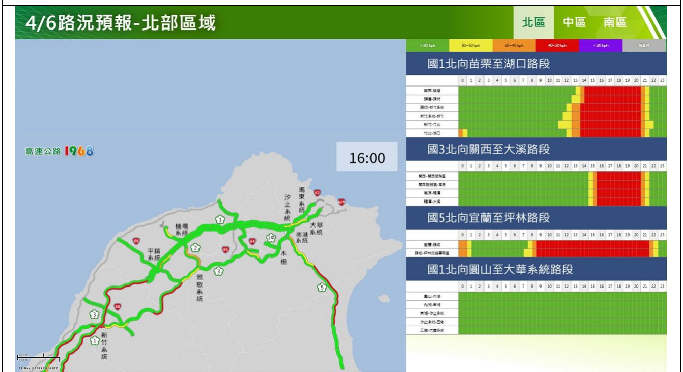
清明節連假收第4日路況預報圖(北區)