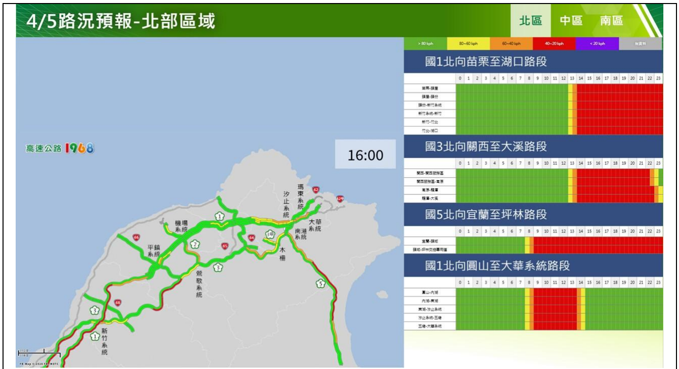
清明節連假收第3日路況預報圖(北區)