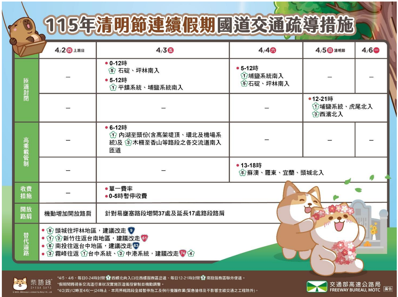
圖 2：115 年清明節連假國道交通疏導措施