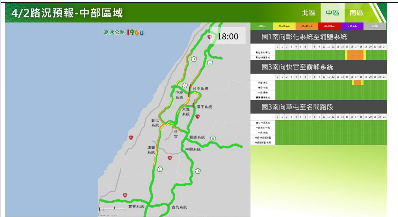
清明節連假前 1 日(上班日)路況預報圖(中區)