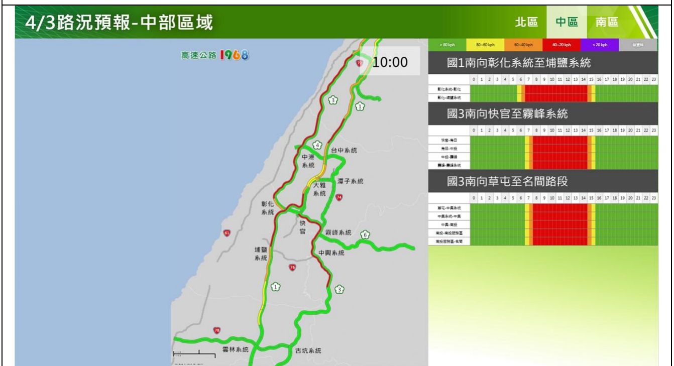
清明節連假第 1 日路況預報圖(中區)