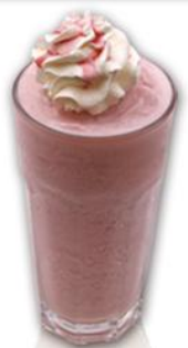
MIXED BERRY YOGURT FRIO