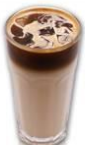
ICED SOY MILK LATTE