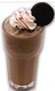
BLUEBERRY TANGO FRIO