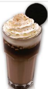
ICED MILKY WAY