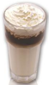
ICED FLAVORED LATTE