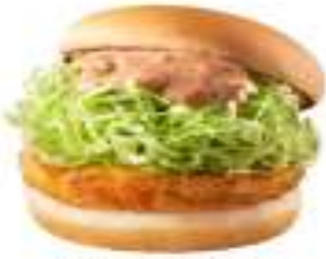
咕咕雞堡 Chicken Burger with Thousand Island Dressing