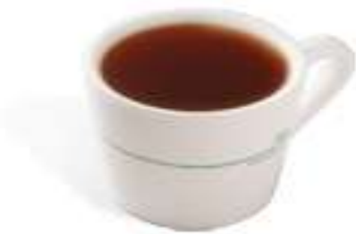
熱紅茶 Hot Black Tea