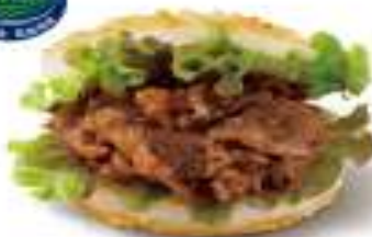
燒肉珍珠堡 Yakiniku Rice Burger