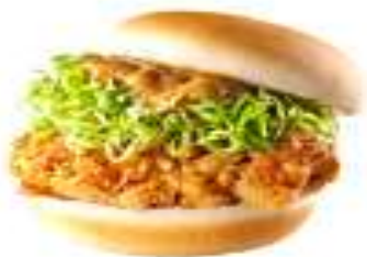
柚香雞腿堡 Citron Chicken Burger