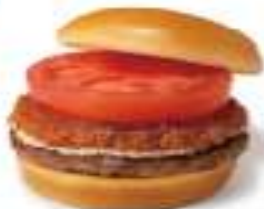
摩斯漢堡(原味/辣味) MOS Burger