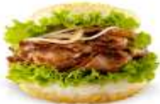
薑燒珍珠堡 Shogayaki Rice Burger