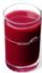
新鮮葡萄原汁 Fresh Grape Juice