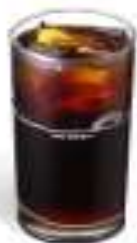
冰摩斯咖啡 Iced MOS Coffee