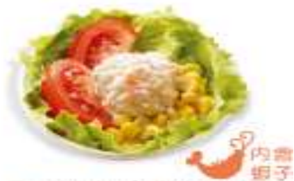
夏威夷鮮蔬沙拉 Hawaii Vegetables Salad