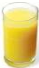
新鮮柳丁原汁 Fresh Orange Juice