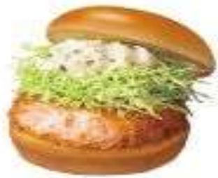
黃金炸蝦堡 Fried Shrimp Burger