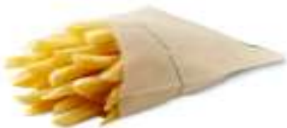
薯條 (L) French Fries (L)