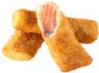
摩斯鮭魚條 MOS Salmon Strips