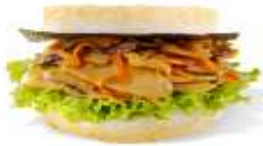
杏鮑菇珍珠堡 Mushroom Rice Burger