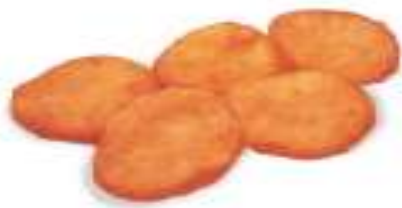
摩斯雞塊5P MOS Chicken Nuggets 5P