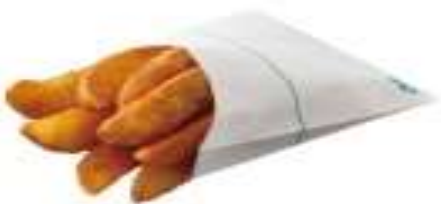
金黃薯 (L) Wedge Cut Fries