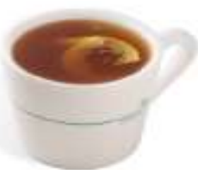
柚子熱茶 Pomelo Tea