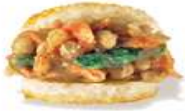
海洋珍珠堡 Seafood Rice Burger