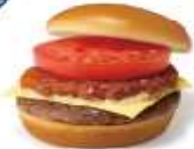
摩斯吉士漢堡(原味/辣味) MOS Cheese Burger