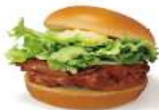
蜜汁烤雞堡 Teriyaki Chicken Burger