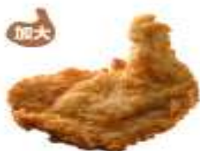
和風炸雞 Japanese Fried Chicken