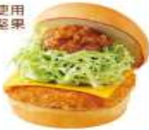
咖哩豬排堡-keema醬 Curry Pork Burger with Keema Sauce