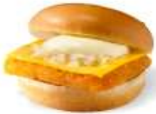
摩斯鱈魚堡 MOS Fish Burger