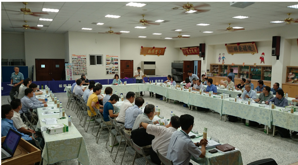
103年度交通工程環境影響評估追蹤考核綜合檢討

(三) 本處103年度辦理相關工程環境影響評估書件變更及環境監測執行情形如表1所示。