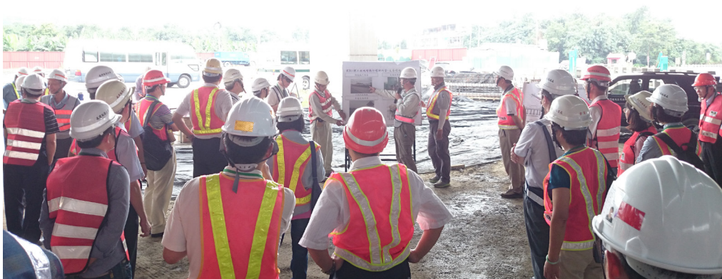
103年度交通工程環境影響評估追蹤考核現場勘察