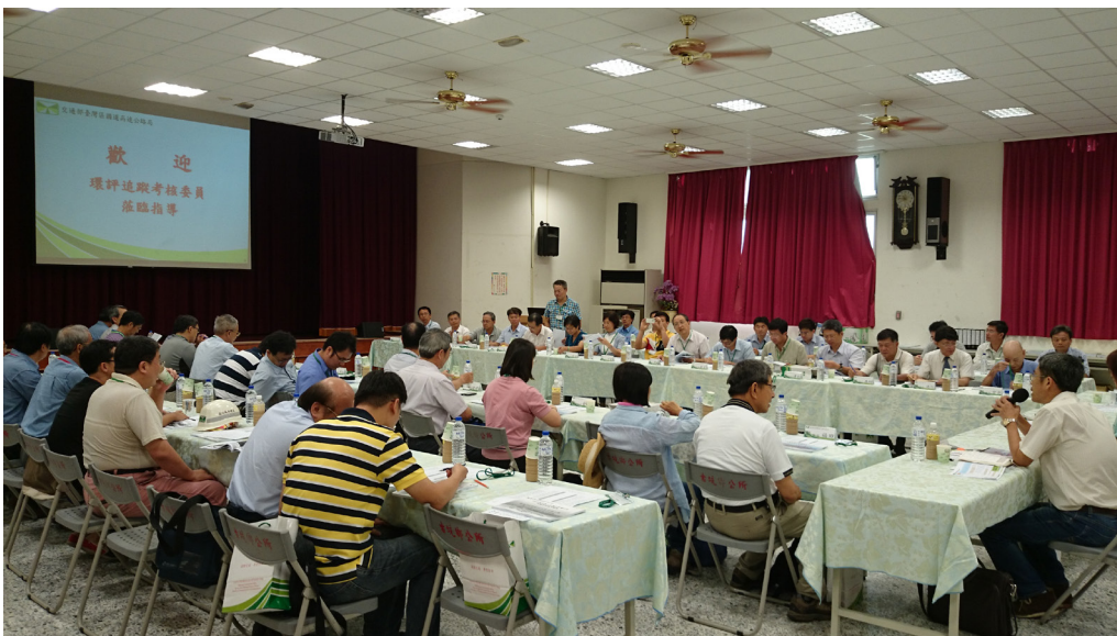
103年度交通工程環境影響評估追蹤考核工程簡報

由交通部總務司長率學者專家、部屬機關代表組成之考核小組及環保署代表等成員，蒞臨現場勘察考核與指導（現場照片如下）。