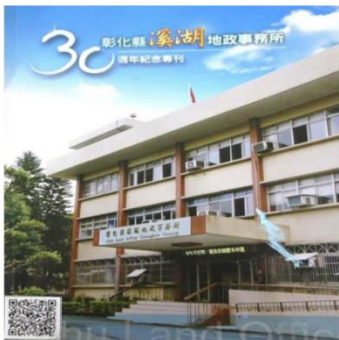
QR Code 連結溪湖地政出版品