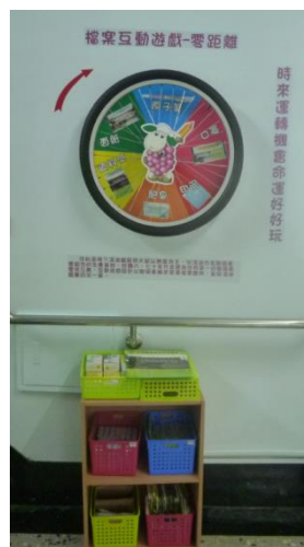
互動的遊戲 轉轉樂