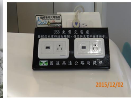
免費電動輪椅充電座