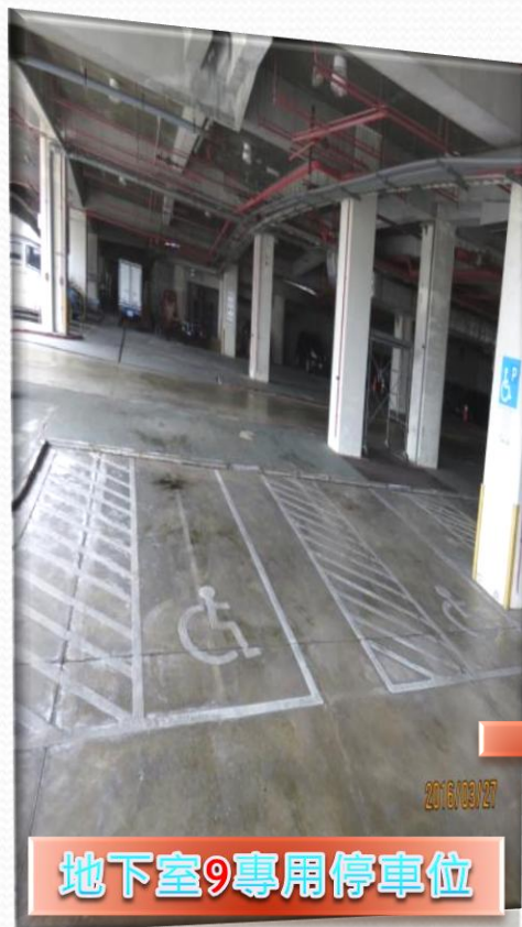
地下室9專用停車位