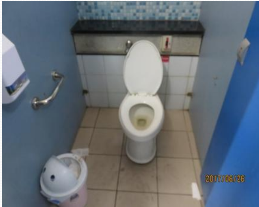
安全扶手-座式廁間