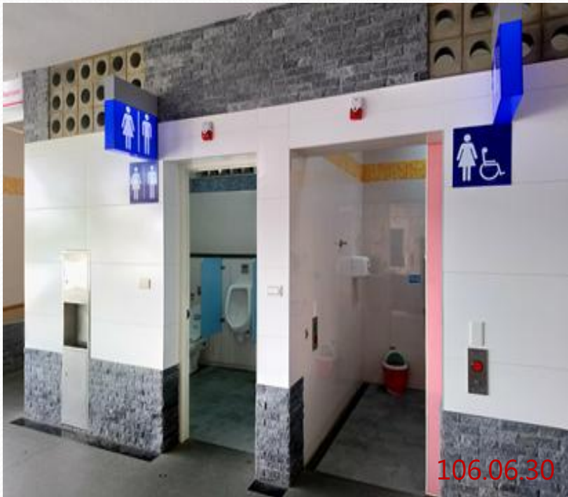
設置性別友善廁所、無障礙廁所