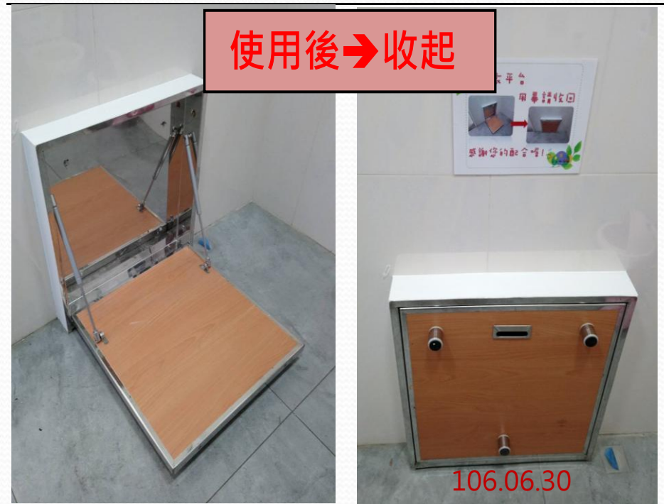
性別友善廁所內亦設置更衣平台