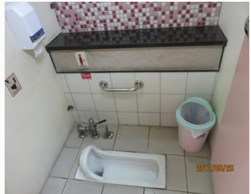
安全扶手-蹲式廁間