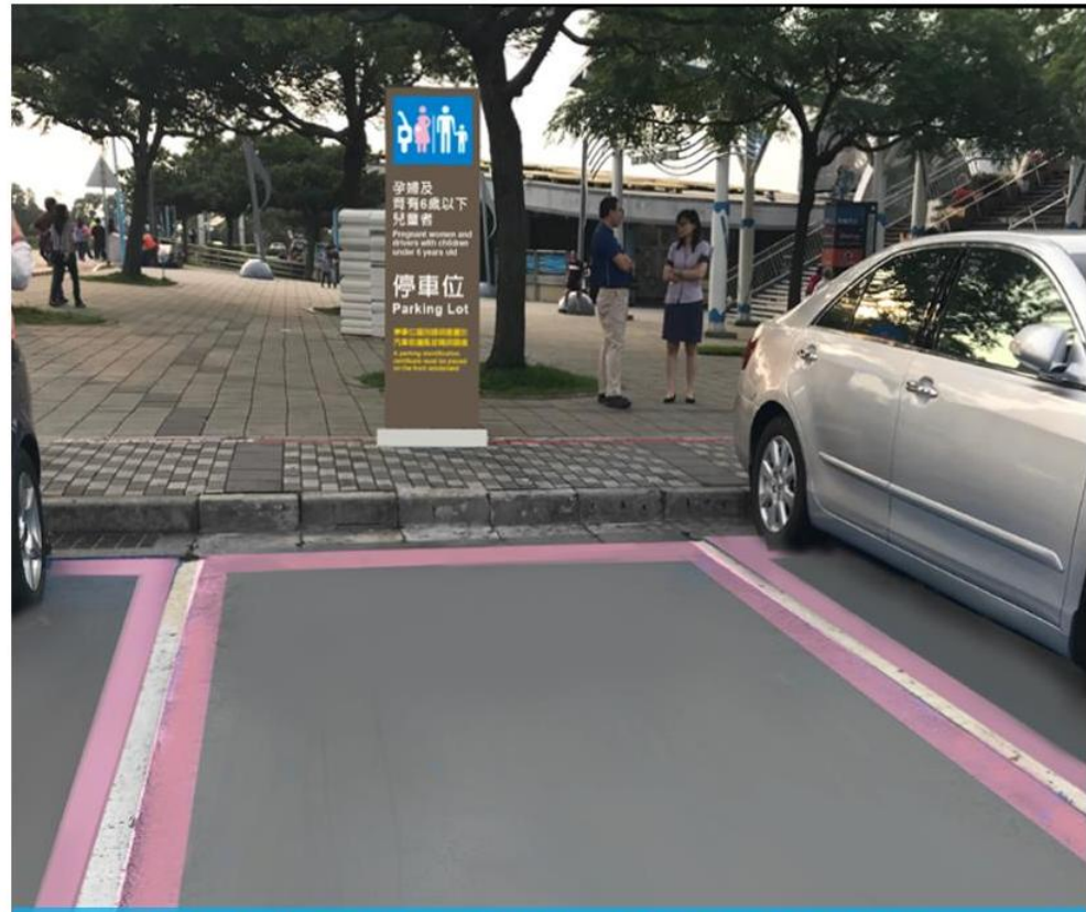
孕婦及育有6歲以下兒童者停車位