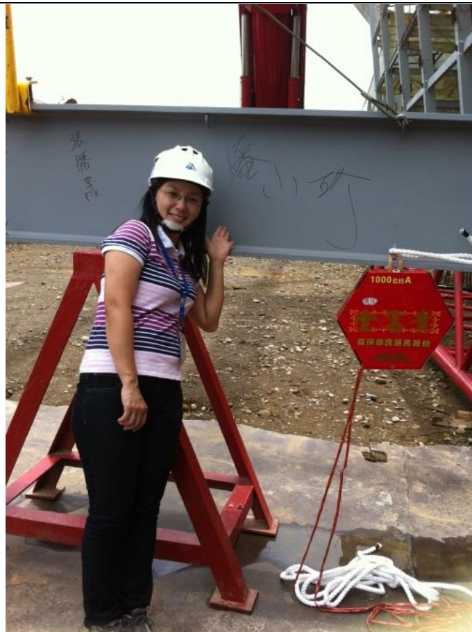
建築工程的上梁儀式是重要的里程碑