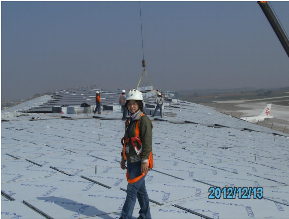
無論屋頂再高都得爬