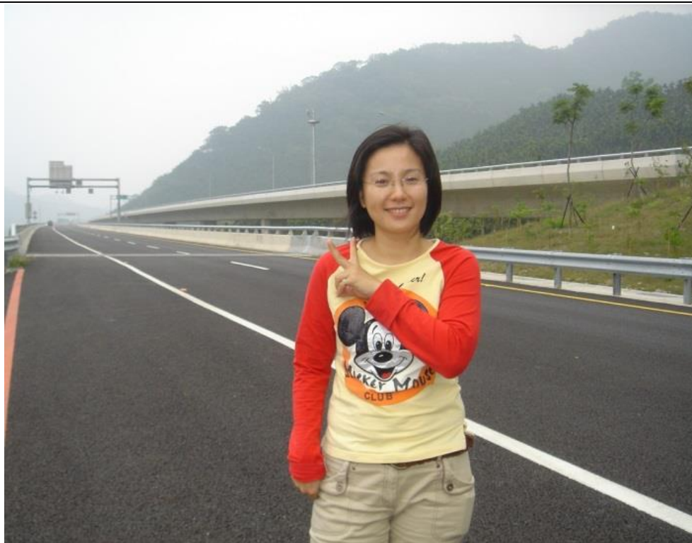
通車前在高速公路漫步是唯一的特權