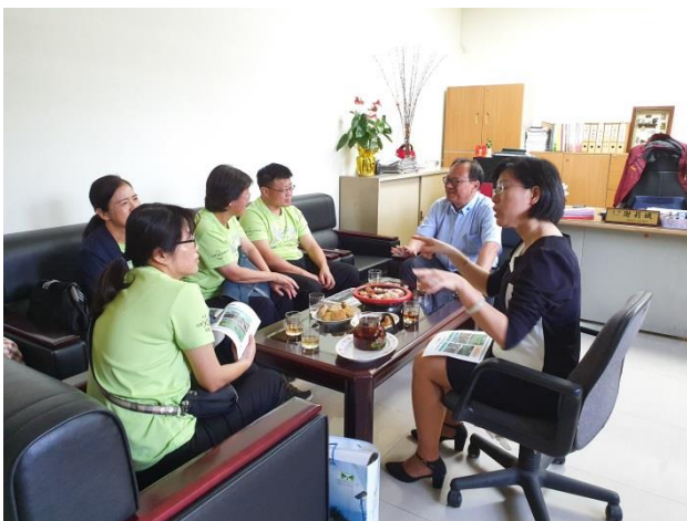
實務經驗分享與意見交換