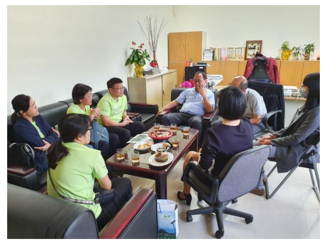
實務經驗分享與意見交換