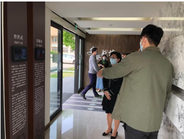
分享本分局檔案布置及金檔獎備審經驗