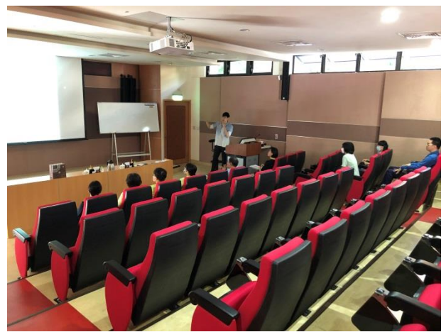
本分局金檔獎及檔管實務經驗簡報