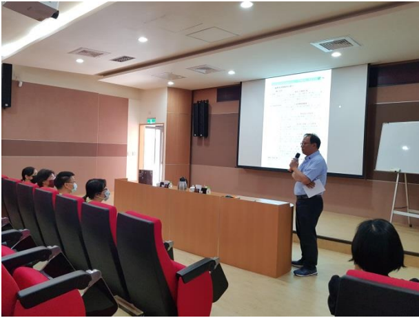
熊副分局長開場引言