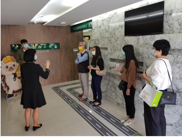
分享本分局檔案布置及金檔獎備審經驗