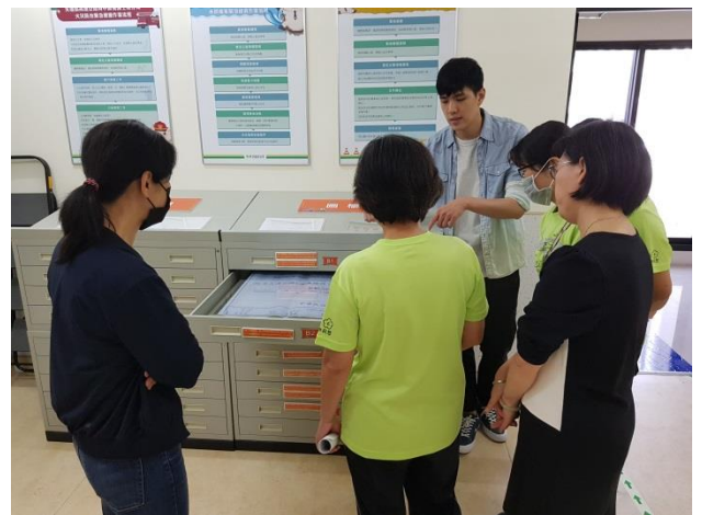
分享本分局庫房建置及備審經驗