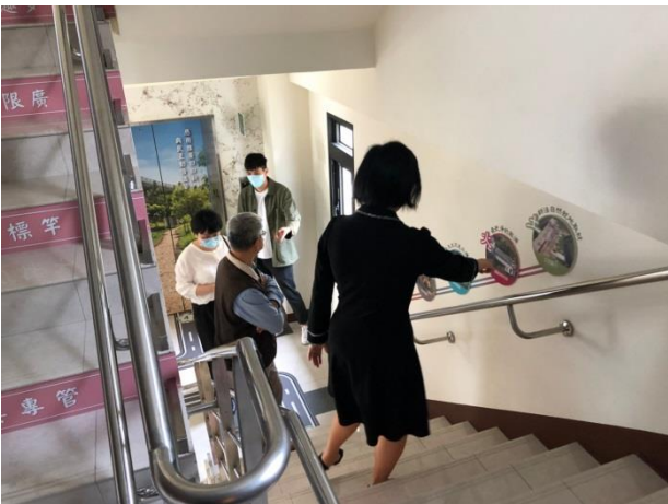
分享本分局庫房建置及備審經驗