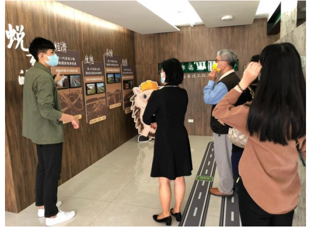
分享本分局檔案布置及金檔獎備審經驗