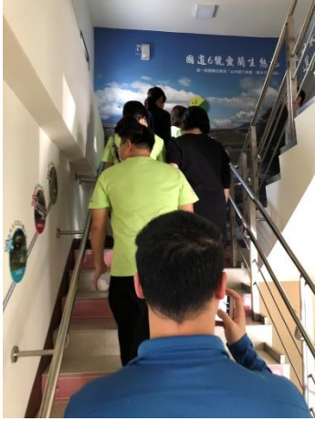
分享本分局庫房建置及備審經驗