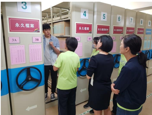
分享本分局庫房建置及備審經驗