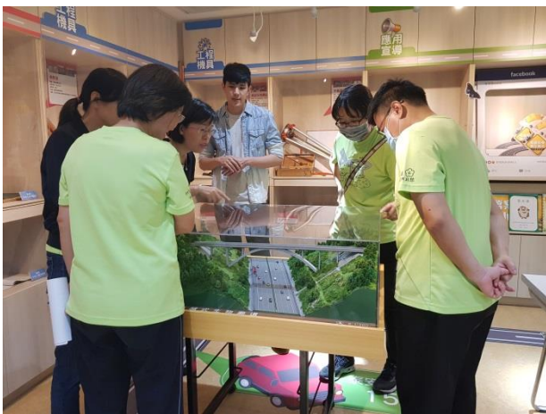
分享本分局檔案布置及金檔獎備審經驗