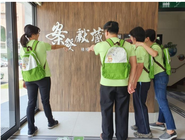
亞洲大學團隊與本分局檔案主題標語合照