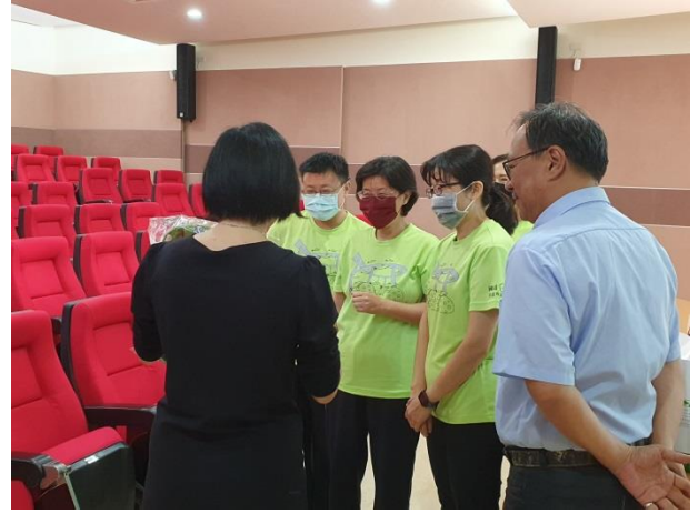
實務經驗分享與意見交換