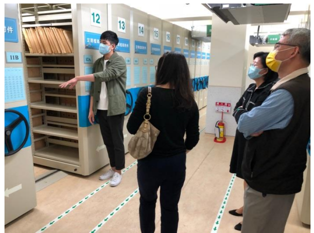
分享本分局庫房建置及備審經驗