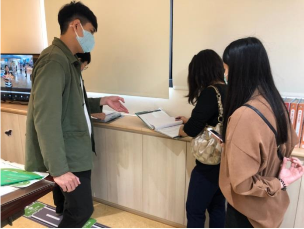
分享本分局閱覽室建置及備審經驗