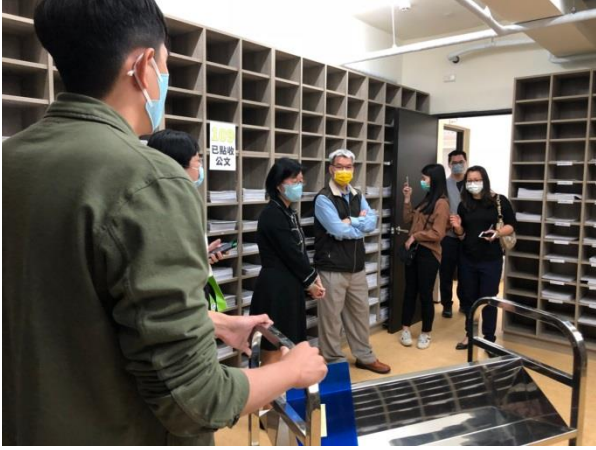
分享本分局庫房建置及備審經驗