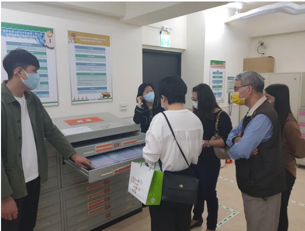
分享本分局庫房建置及備審經驗