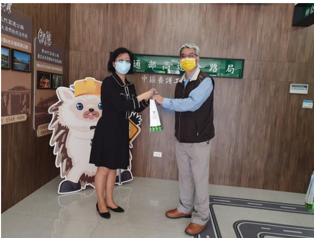
謝主任代表致贈紀念品