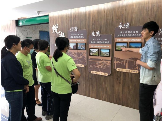
分享本分局檔案布置及金檔獎備審經驗