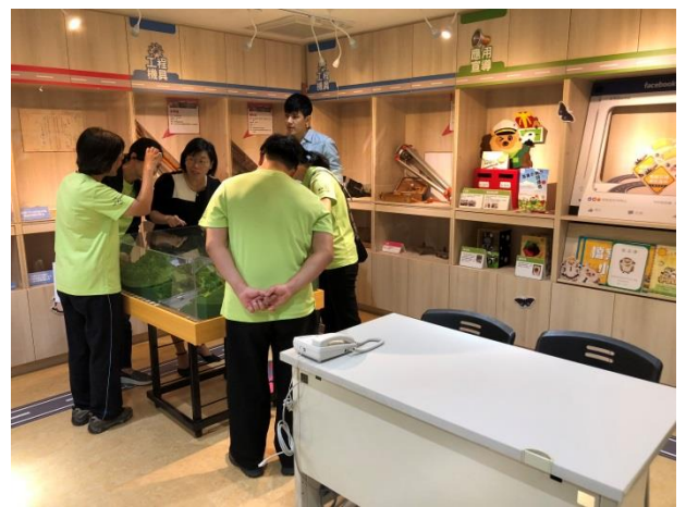
分享本分局檔案布置及金檔獎備審經驗