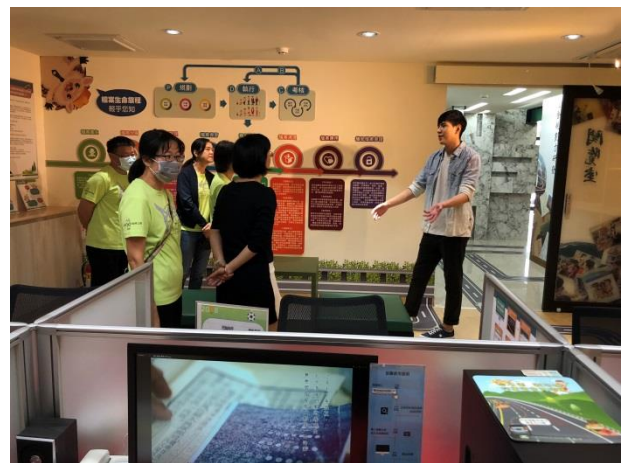
分享本分局檔案布置及金檔獎備審經驗