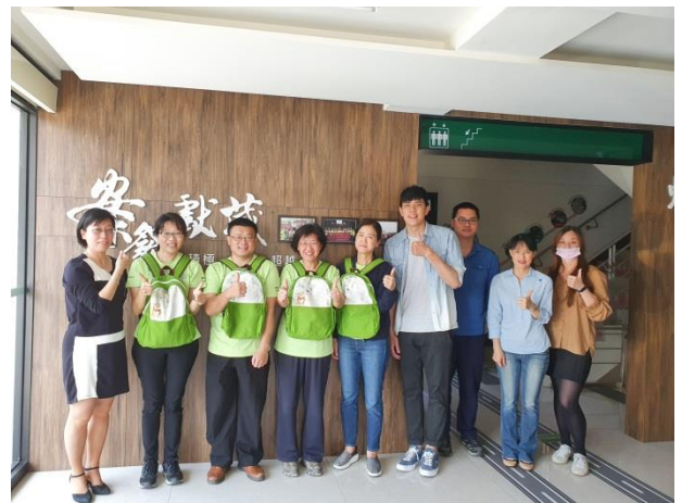
與會人員合影留念