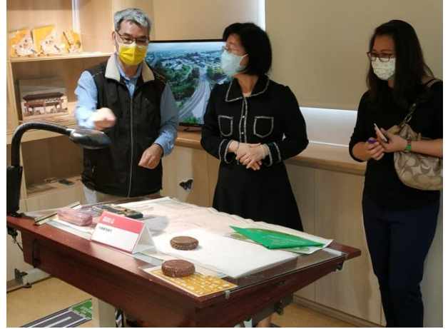
分享本分局閱覽室建置及備審經驗