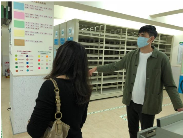
分享本分局庫房建置及備審經驗