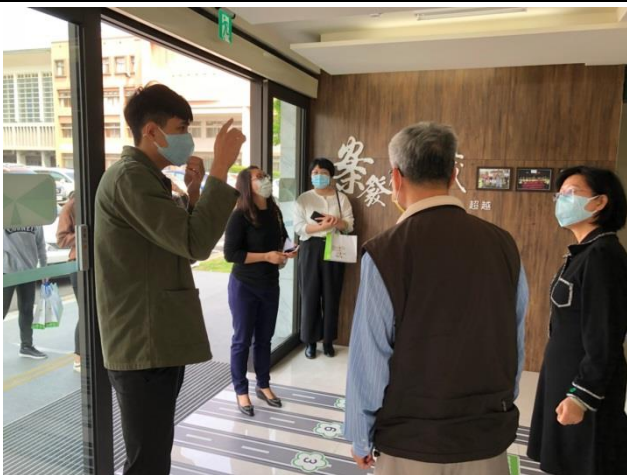
分享本分局檔案布置及金檔獎備審經驗