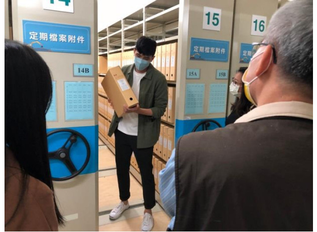
分享本分局庫房建置及備審經驗