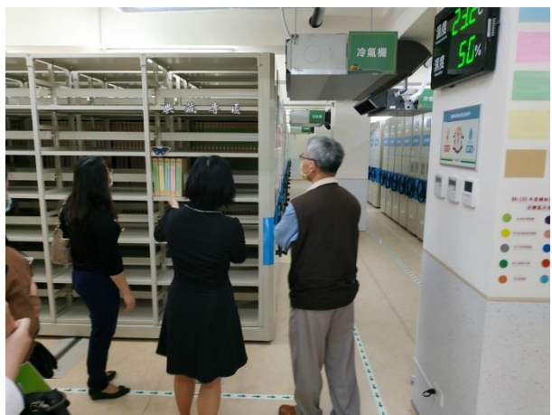
分享本分局庫房建置及備審經驗