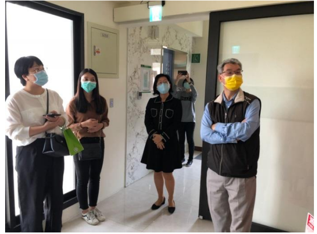
分享本分局庫房建置及備審經驗