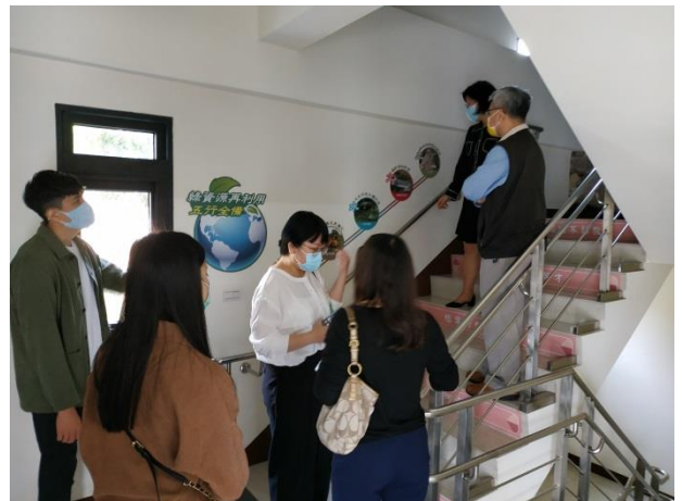
分享本分局庫房建置及備審經驗