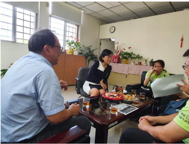
實務經驗分享與意見交換