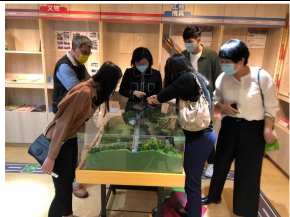
分享本分局檔案布置及金檔獎備審經驗