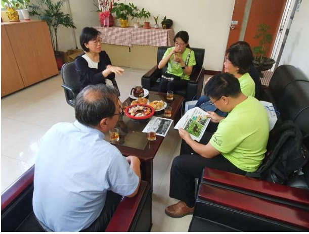
實務經驗分享與意見交換