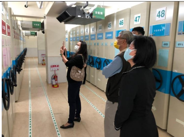
分享本分局庫房建置及備審經驗