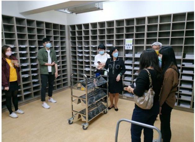
分享本分局庫房建置及備審經驗