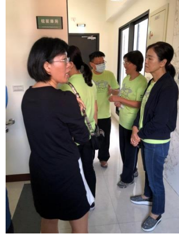
分享本分局庫房建置及備審經驗