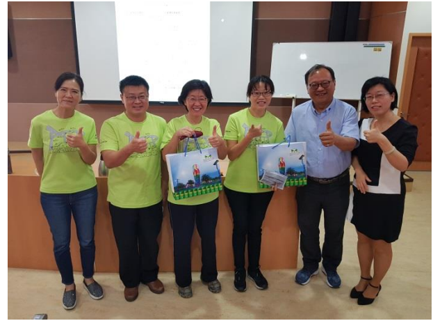
熊副分局長與謝主任代表致贈紀念品