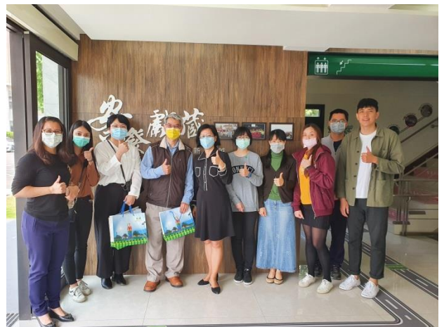
與會人員合影留念