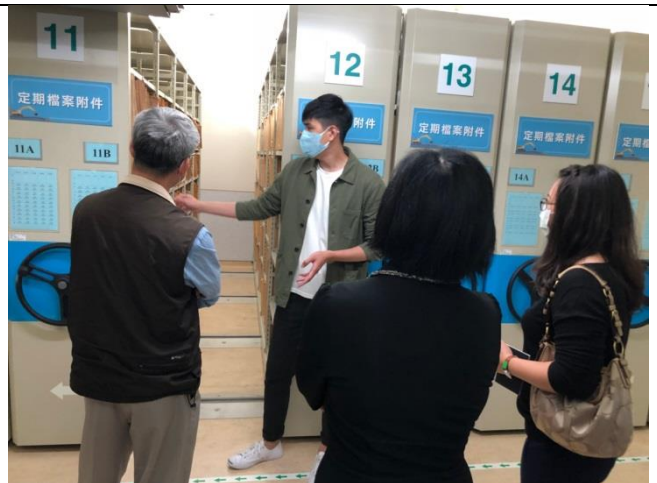
分享本分局庫房建置及備審經驗