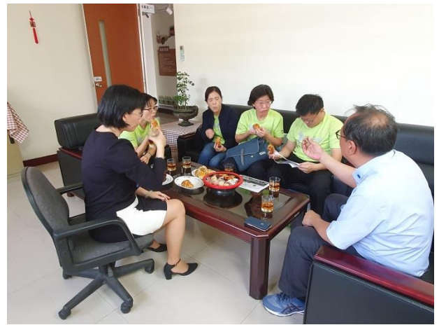
實務經驗分享與意見交換