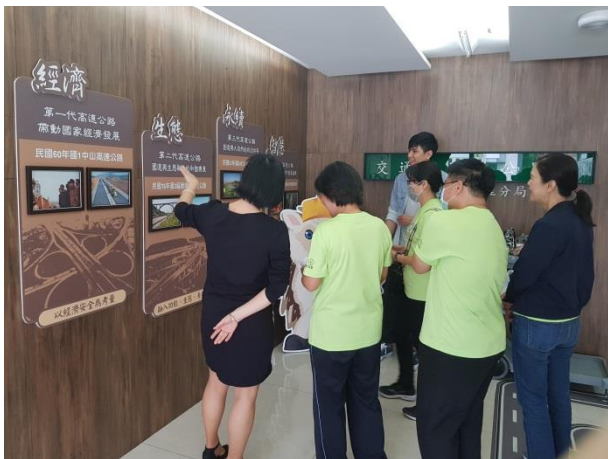
分享本分局檔案布置及金檔獎備審經驗