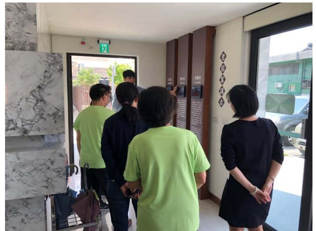
分享本分局檔案布置及金檔獎備審經驗