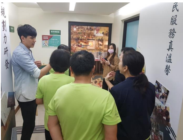
分享本分局檔案布置及金檔獎備審經驗