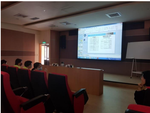
本分局金檔獎及檔管實務經驗簡報