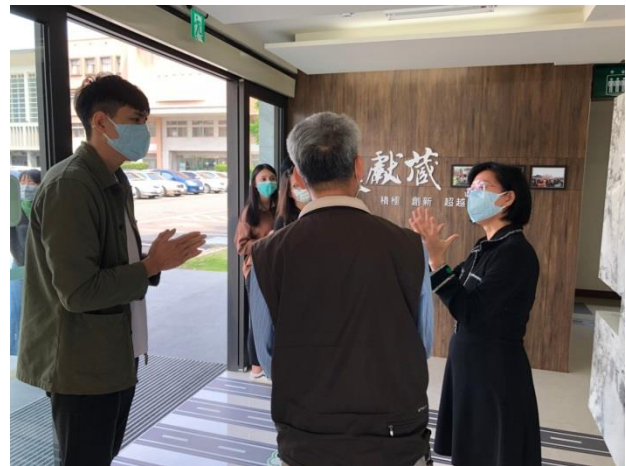
分享本分局檔案布置及金檔獎備審經驗