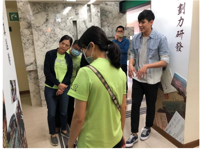
分享本分局檔案布置及金檔獎備審經驗