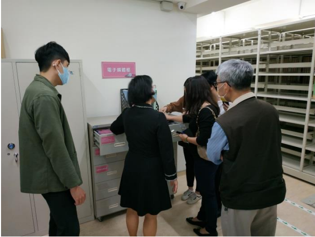
分享本分局庫房建置及備審經驗