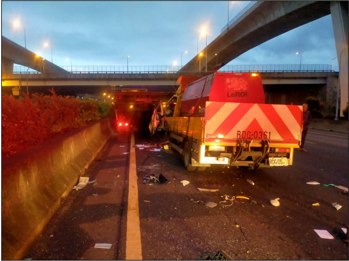
圖 2、事故現場照片 1