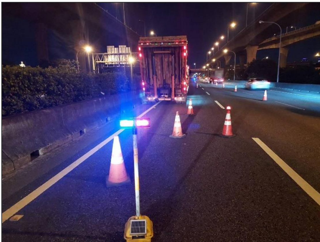
圖 4、停車車輛後方設置交通錐及爆閃燈