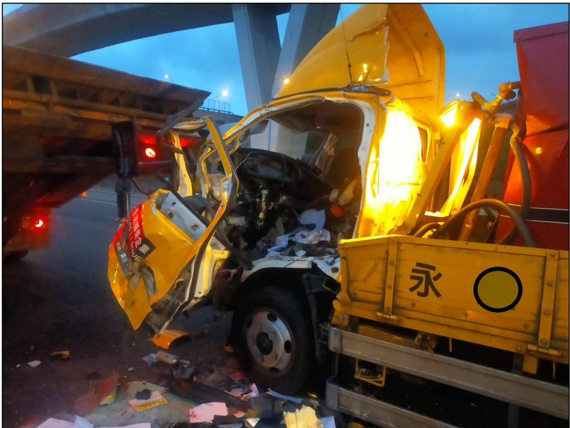
圖 3、事故現場照片 2