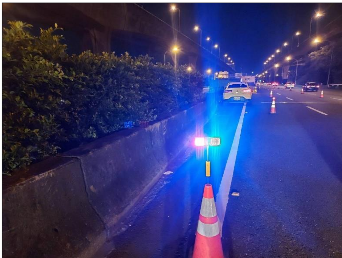
圖 5、停等車輛皆須停放於停等區內區域(警示燈區域內)