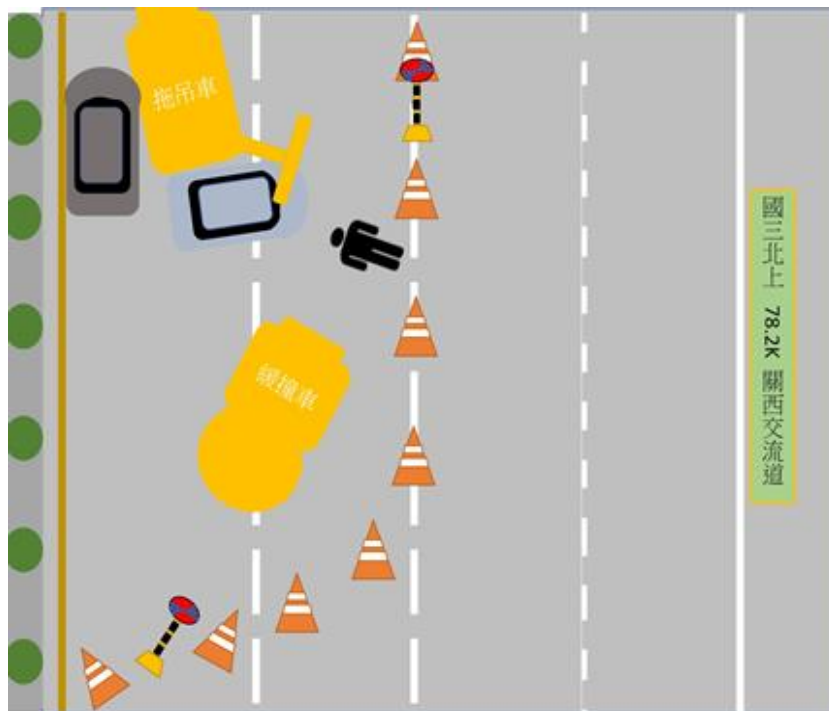
圖 2、事故現場示意圖