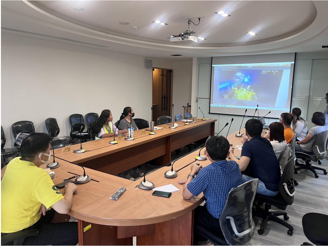
圖 10、工務段職災檢討會