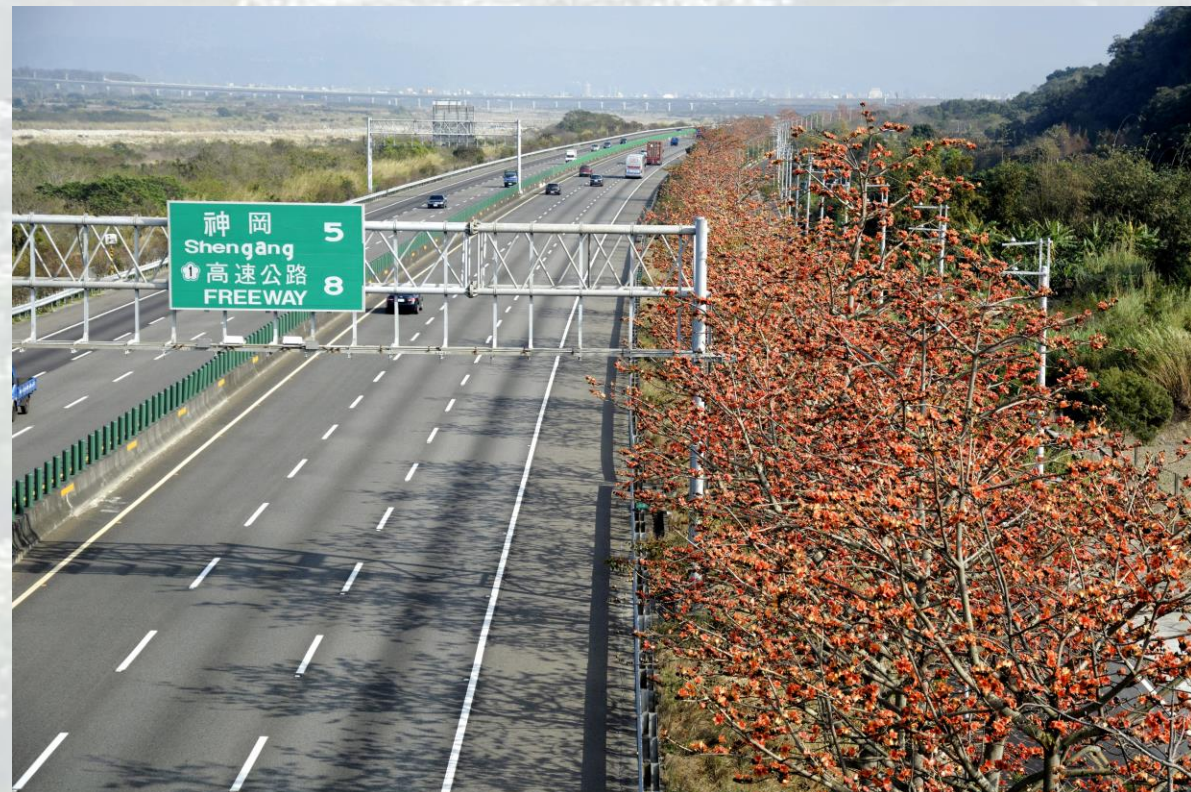
國道4號-東向約4k-木棉