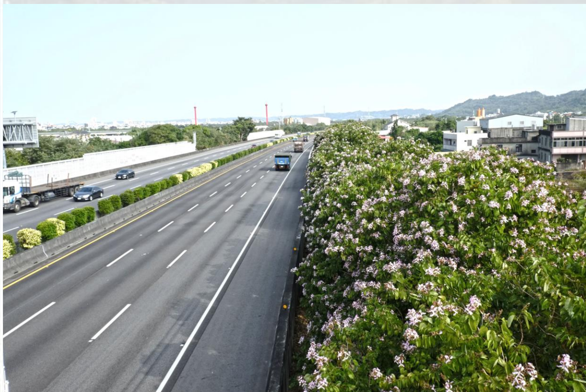
國道1號-北上約112k~114k-洋紫荊