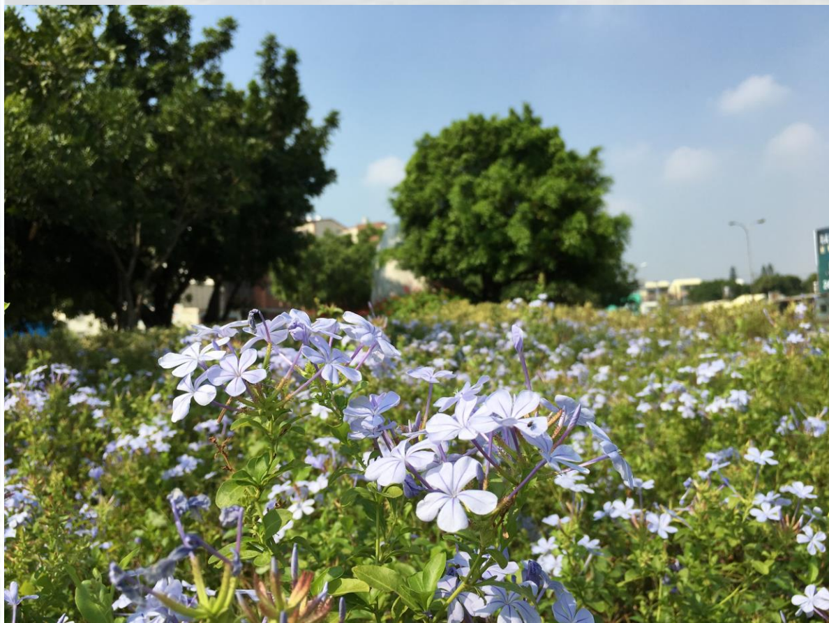
國道1號-南屯交流道-藍雪花