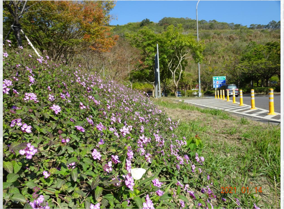
國道3號-南投服務區-蜜源植物區-蔓性馬纓丹