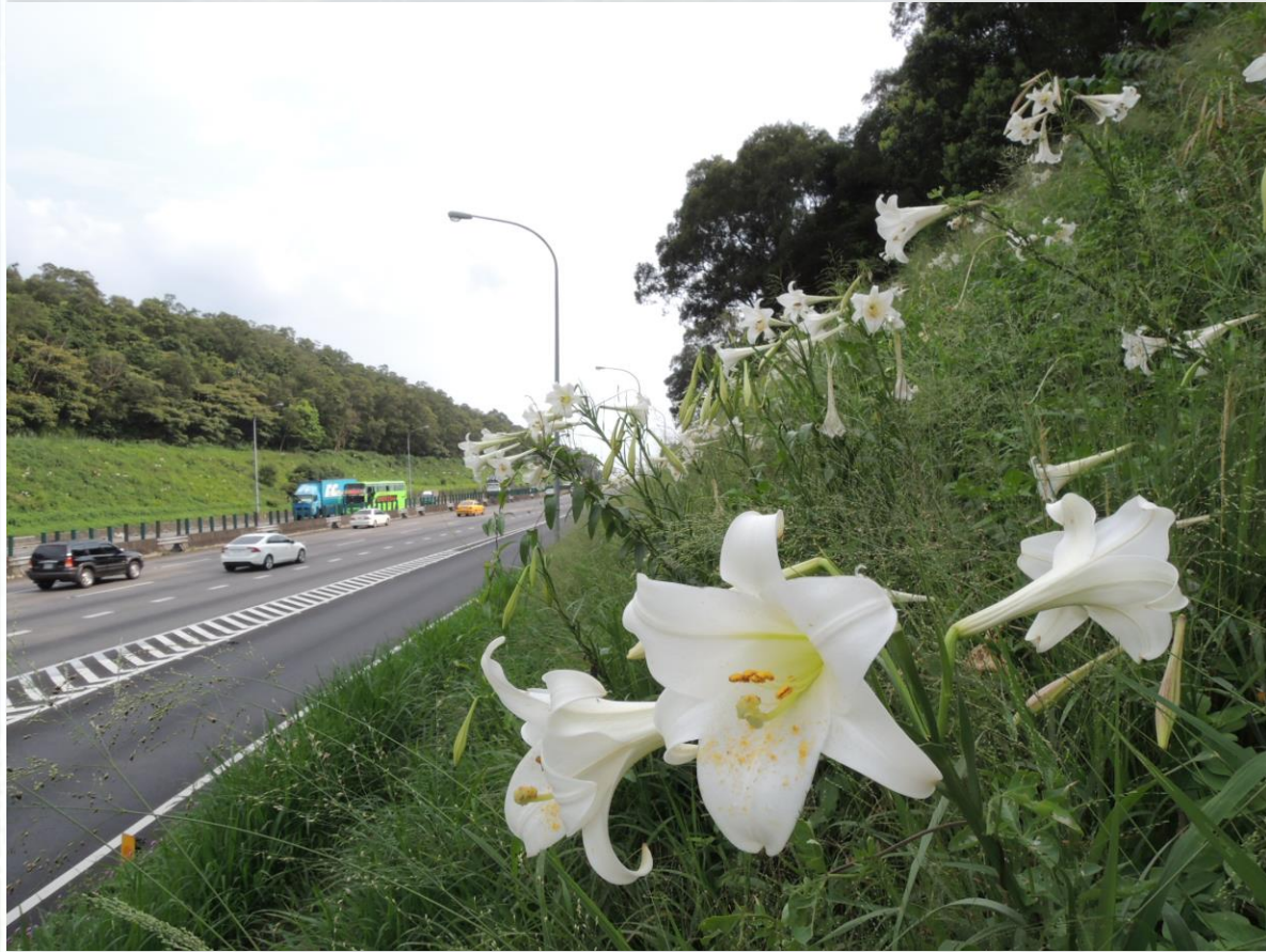
國道1號-151k南北雙向邊坡-百合