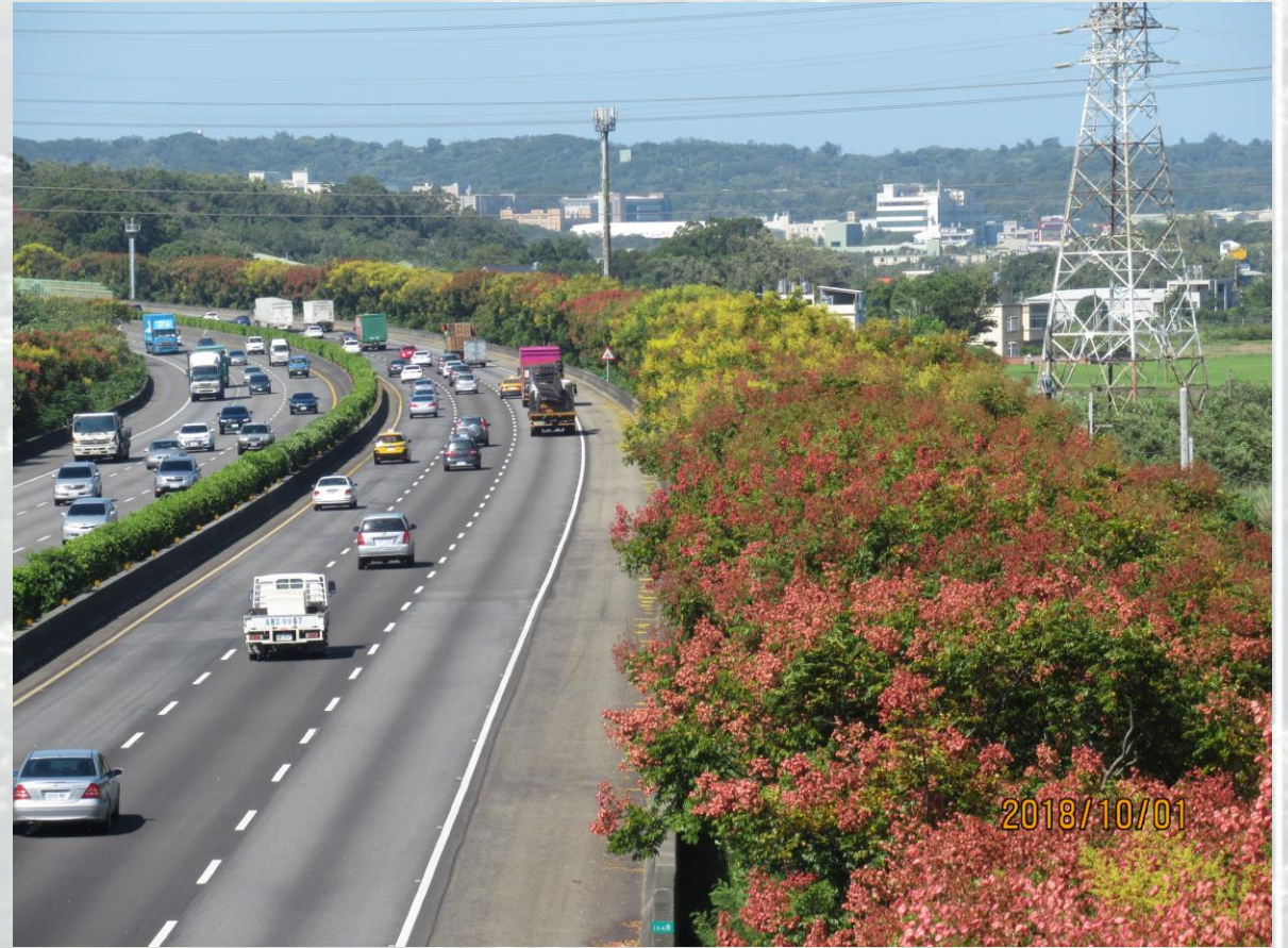
國道1號-南下104k+800-台灣欒樹