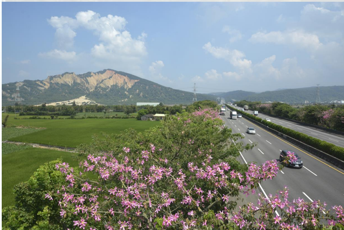
國道1號-南下約156k~157k-美人樹