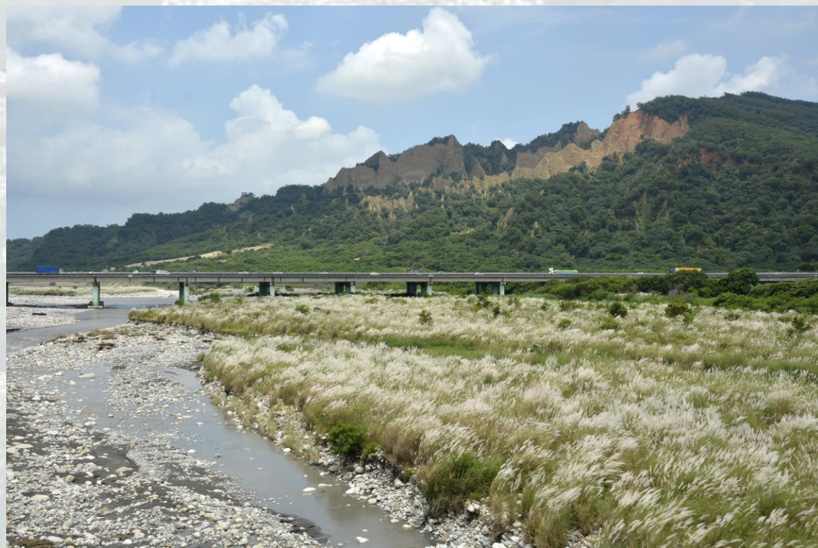
國道1號-大安溪-甜根子草