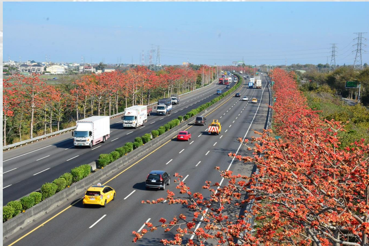
國道1號-北斗交流道約221~219k-木棉