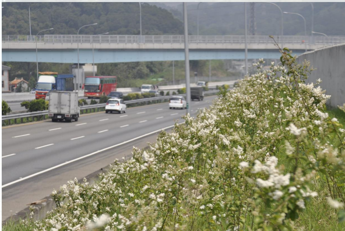
國道1號-頭屋交流道-日本女貞