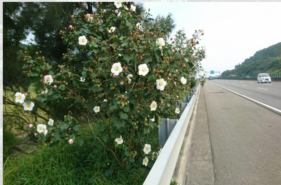
國道3號-後龍收費站-山芙蓉