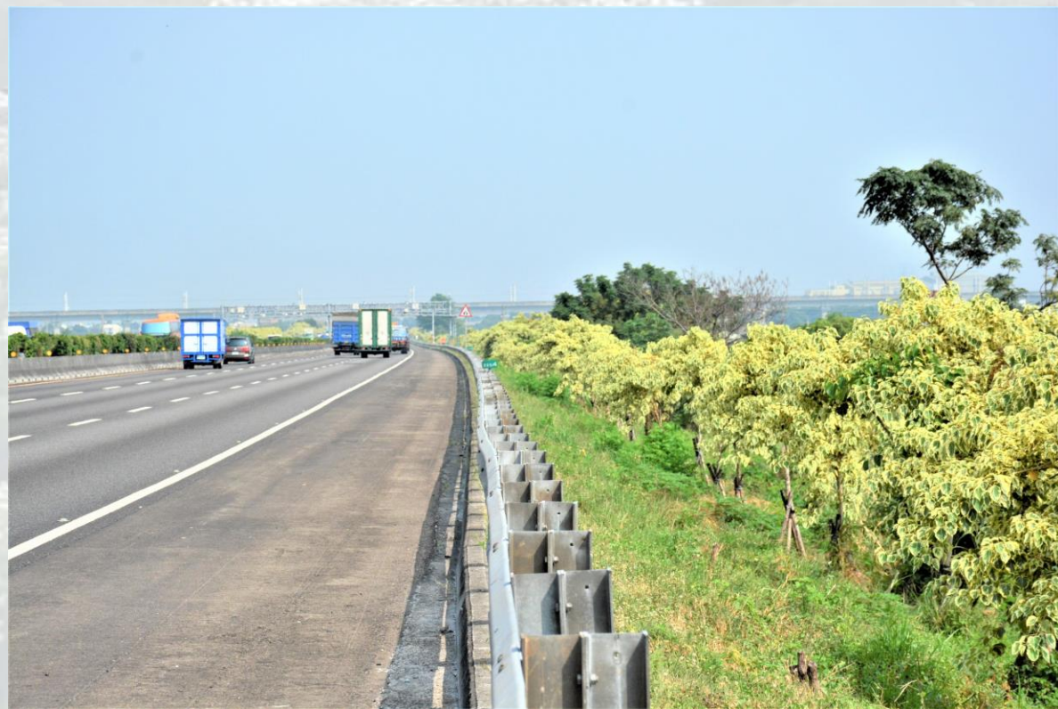
國道1號-北上及南下約223~226k-斑葉菩提