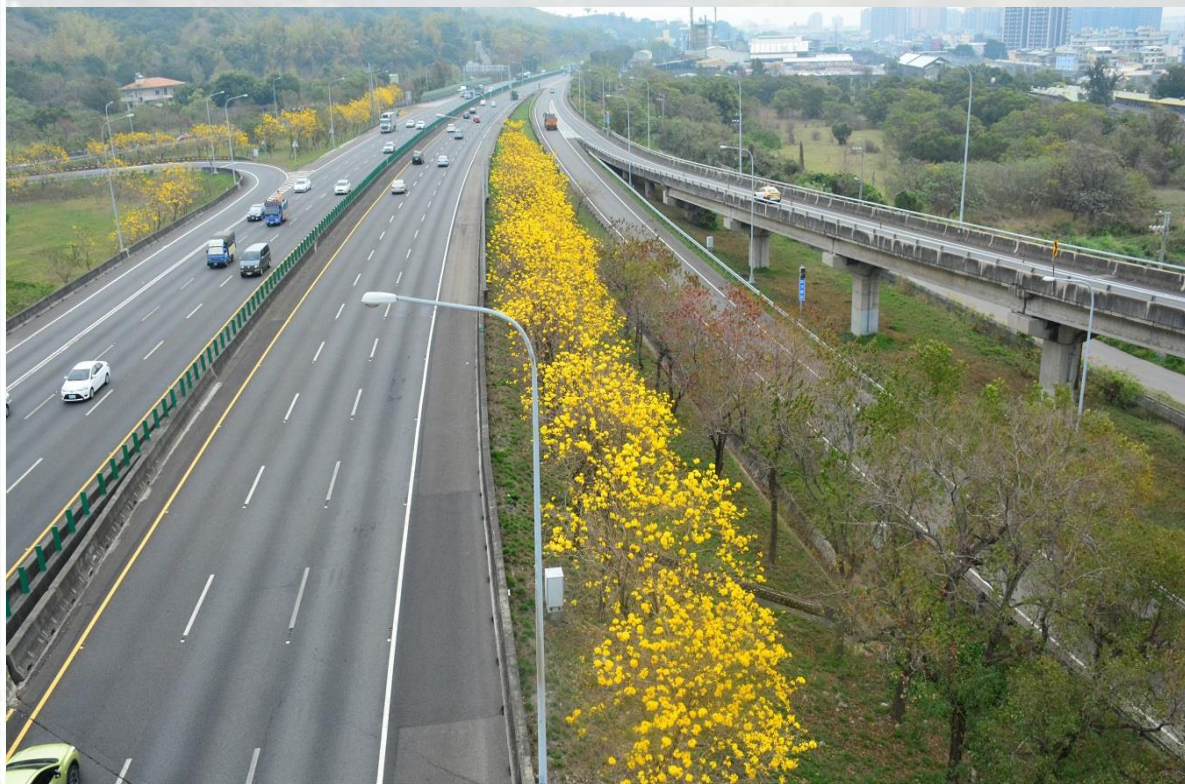
國道1號-王田交流道約189k-黃花風鈴木