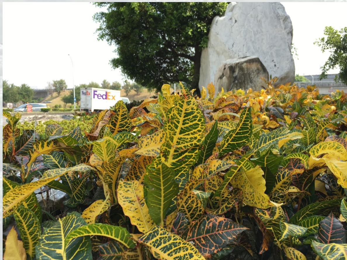
國道1號-南屯交流道-變葉木