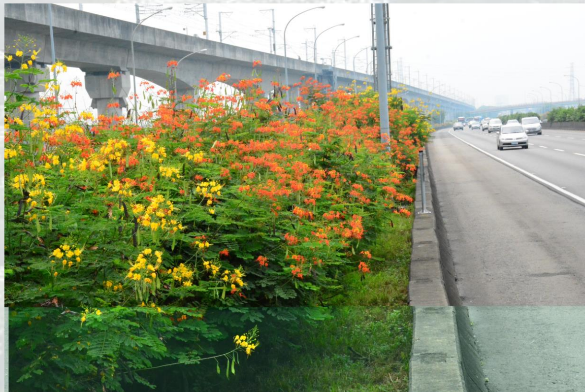
國道1號-南屯交流道約181k+400-番蝴蝶