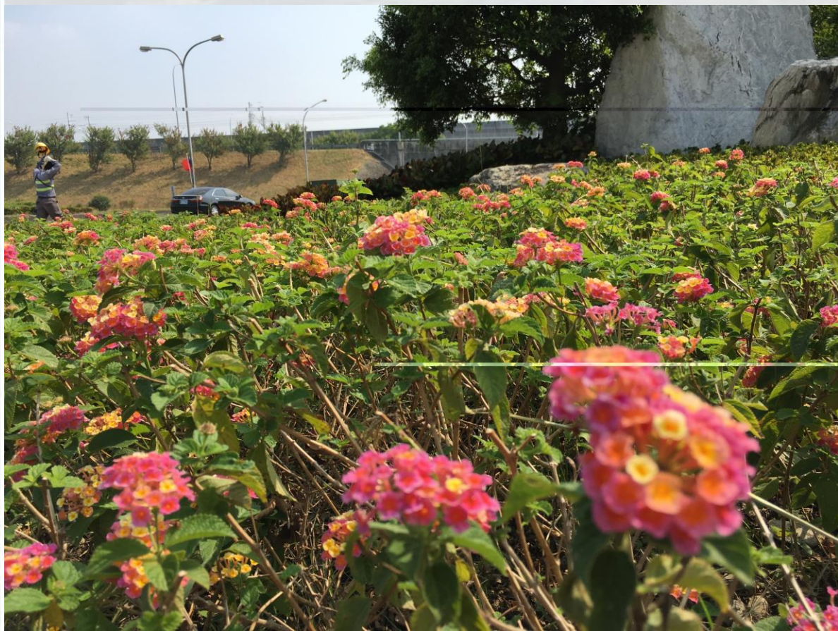
國道1號-南屯交流道-馬纓丹