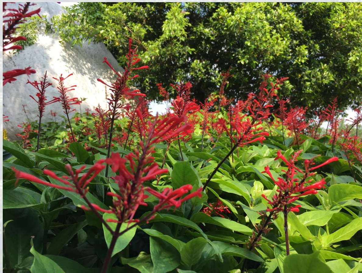
國道1號-南屯交流道-紅樓花