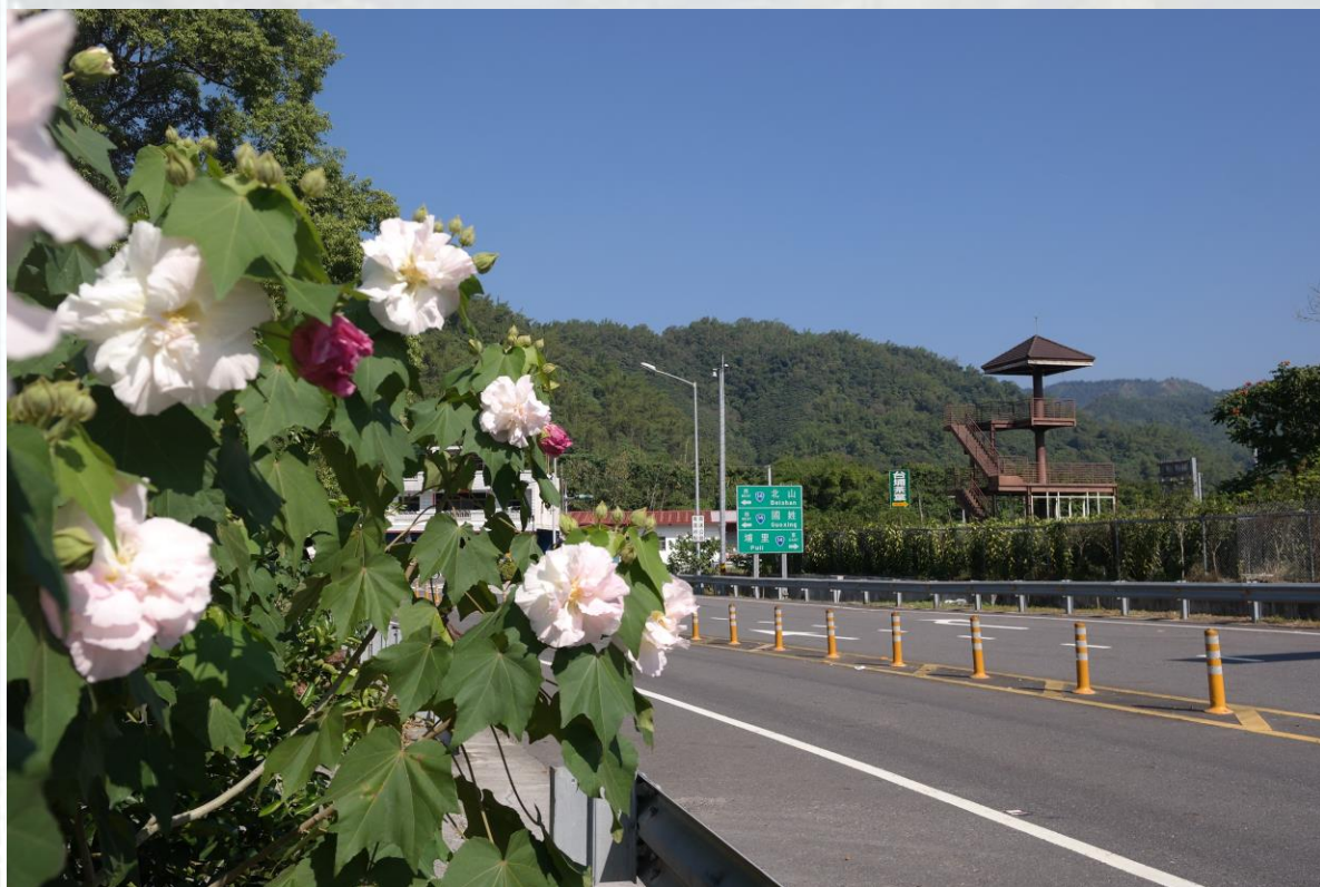
國道6號-北山交流道-山芙蓉