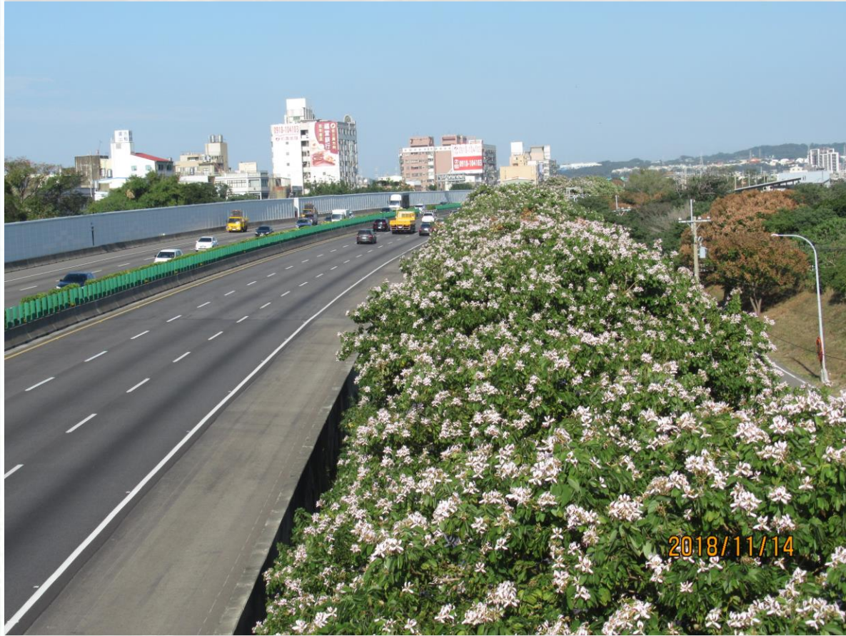
國道1號-北上112k+200-洋紫荊